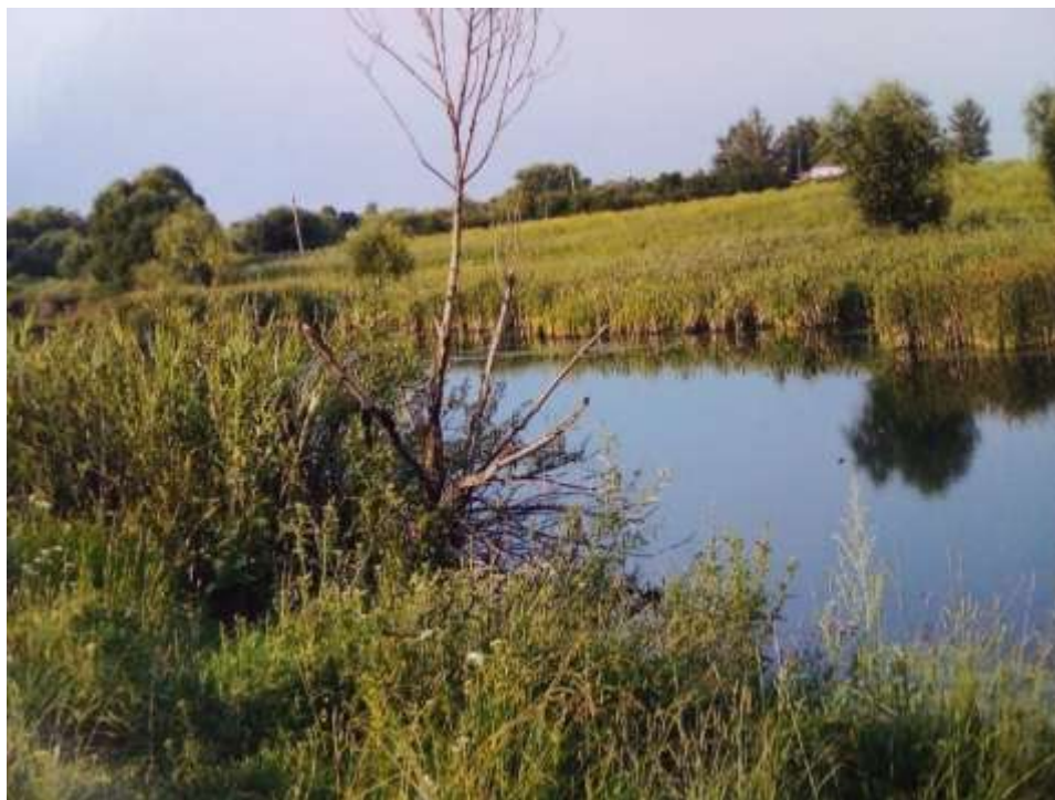
Река «Малый Эртиль»

Село Карпели расположено по обе стороны речки «Малый Эртиль», самой южной части Усманского уезда. Село относилось к Воронежской губернии.