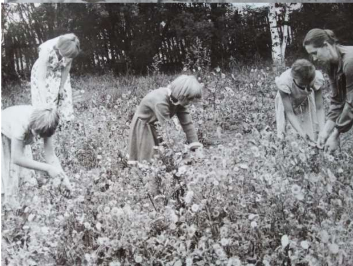
Работа на школьном приусадебном участке