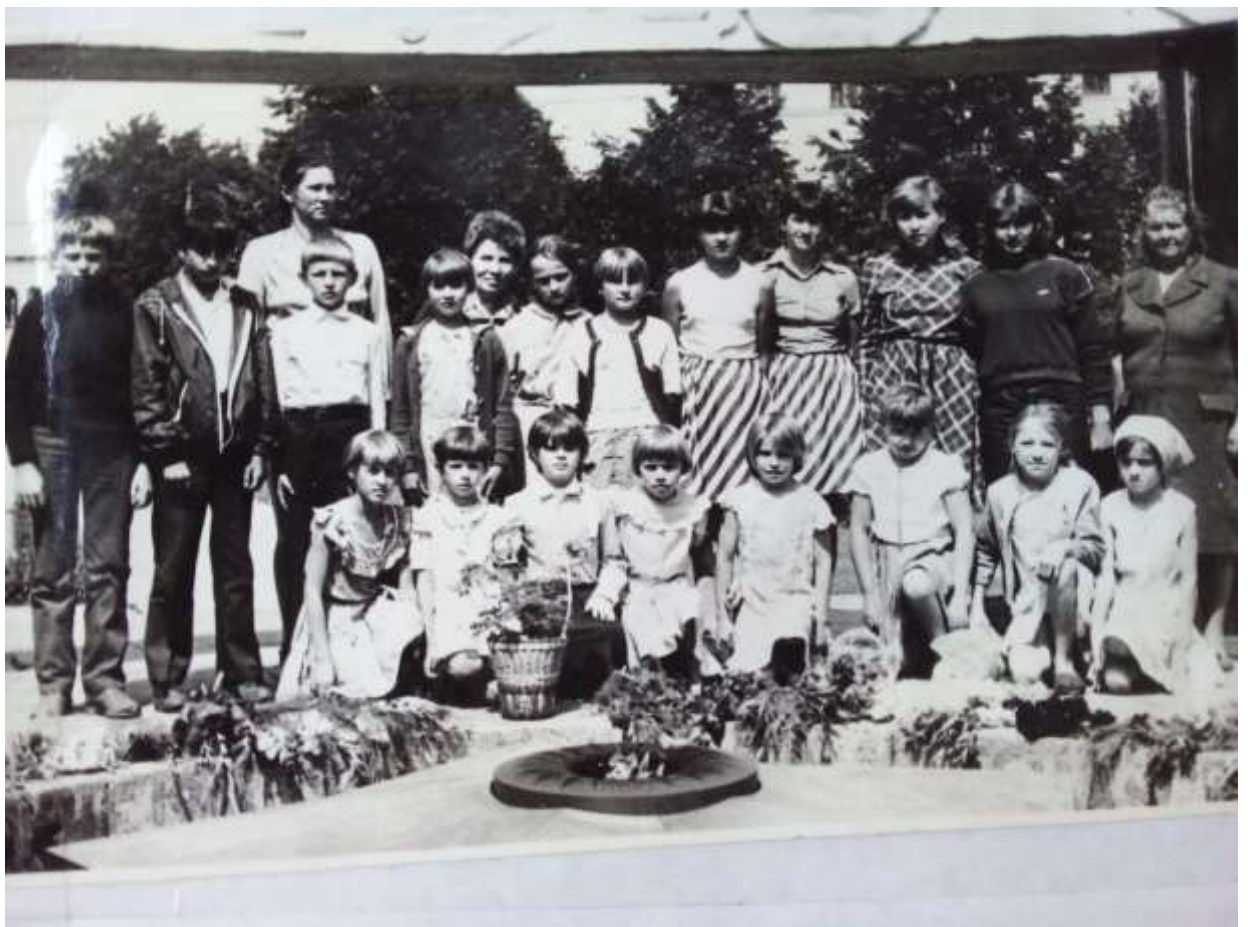
Экскурсия школьников в город Тамбов