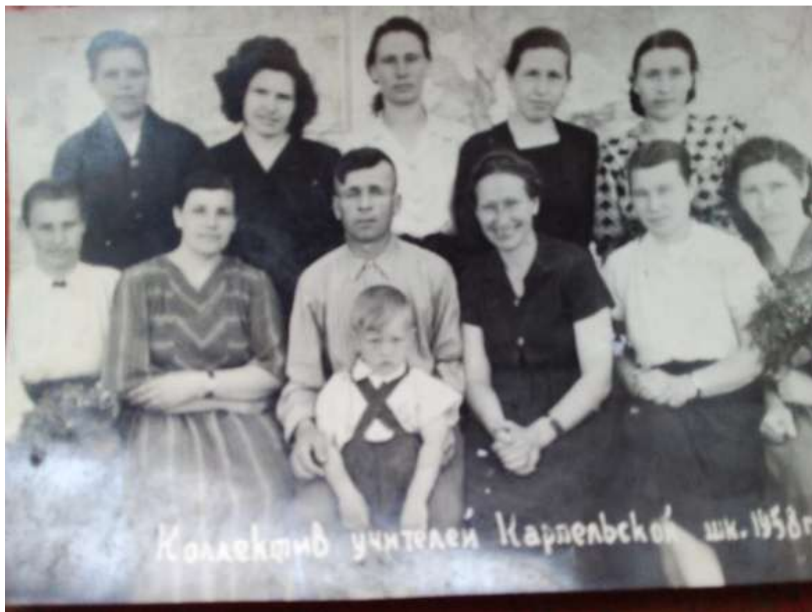
Коллектив учителей Карпельской шк. 1958 г.